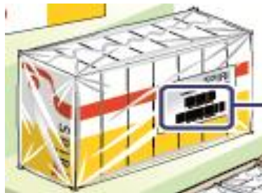
Caja Unidad Despacho